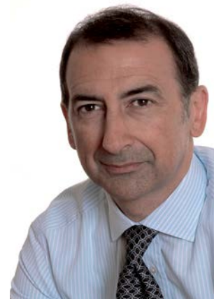
Sindaco Comune di Milano Giuseppe Sala

Il Milan International Film Festival, con il suo "award" dedicato al genio di Leonardo, un vero punto di riferimento a livello internazionale con film indipendenti provenienti da tutto il mondo, interpreta al meglio questa vocazione. Il Comune e i milanesi salutano quindi con piacere questa nuova edizione del MIFF Awards che conferma la bontà del progetto culturale che ha ispirato questi primi 18 anni di storia e di successi e che contribuirà a promuovere il cinema libero e di qualità e con esso ad affermare ancora di più l'immagine internazionale di Milano e il suo ruolo di grande polo artistico e culturale.