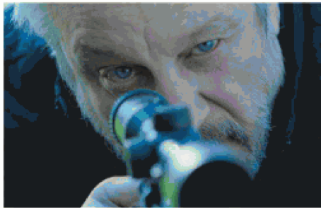
IN RASSEGNA Un'immagine di «Maracaibo», in alto, dedicato a un padre che dà la caccia all'assassino del figlio. Sotto, «My Tourette's» in programma martedì sera

i documentari. Le altre serate, nei successivi mercoledì al Palazzo del Cinema Anteo, nei medesimi orari, vedranno la proiezione di un corto e, a seguire, di un film. Mercoledì 30 sarà la volta di Roll with me di