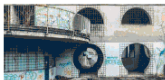
A DUE SETTIMANE DAL VOTO «Case bianche» a Brescia ghetti tra rifiuti e paura