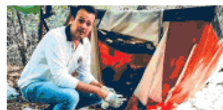
ALLE GROANE Nel parco dello spaccio i pusher arrivano in treno